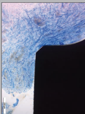
図 2: 図 1 の高倍率画像。マイクログループを付与したアバットメントの表面に密接に接触している結合組織