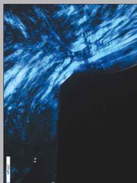
図 3: 図 2 の偏光顕微鏡像。アバットメント表面に対して機能的に並ぶコラーゲン線維