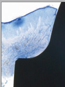
図 1: トルイジンブルー / Azur II で染色した研磨標本。マイクログループ表面の歯冠側で次第に減少している口腔上皮および付着上皮

NC Geurs, PJ Vassilopoulos, MS Reddy. Clinical Advances in Periodontics , Vol. 1, No. 1, May 2011.