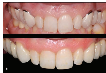
図2：治療前 (A)、治療後 (B)