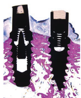
図 4: 3ヶ月後において歯槽頂骨吸収はみられない。レーザーアブレーションカラー部への広範囲な骨接触